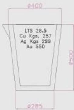
CROGIOLO A.200 CRUCIBLE A.200