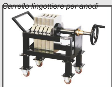
Carrello lingottiere per anodi