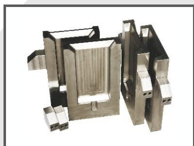
Anodes ingot moulds